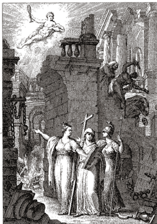
A la NACIÓN ESPAÑOLA que aprueba en la REBELIÓN y excita por la LIBERTAD dentro el edificio de la Inquisición. Luego desahucados la SEVERIDAD con el FASCISMO y la IMPUREZA y la VERDAD aparece triunfante en el cielo.

Felipe II implantó la Inquisición en América con el objetivo de evitar la entrada del protestantismo desde Europa. En 1569 se crearon los tribunales de México (Virreinato de Nueva España), de Lima (Virreinato del Perú)