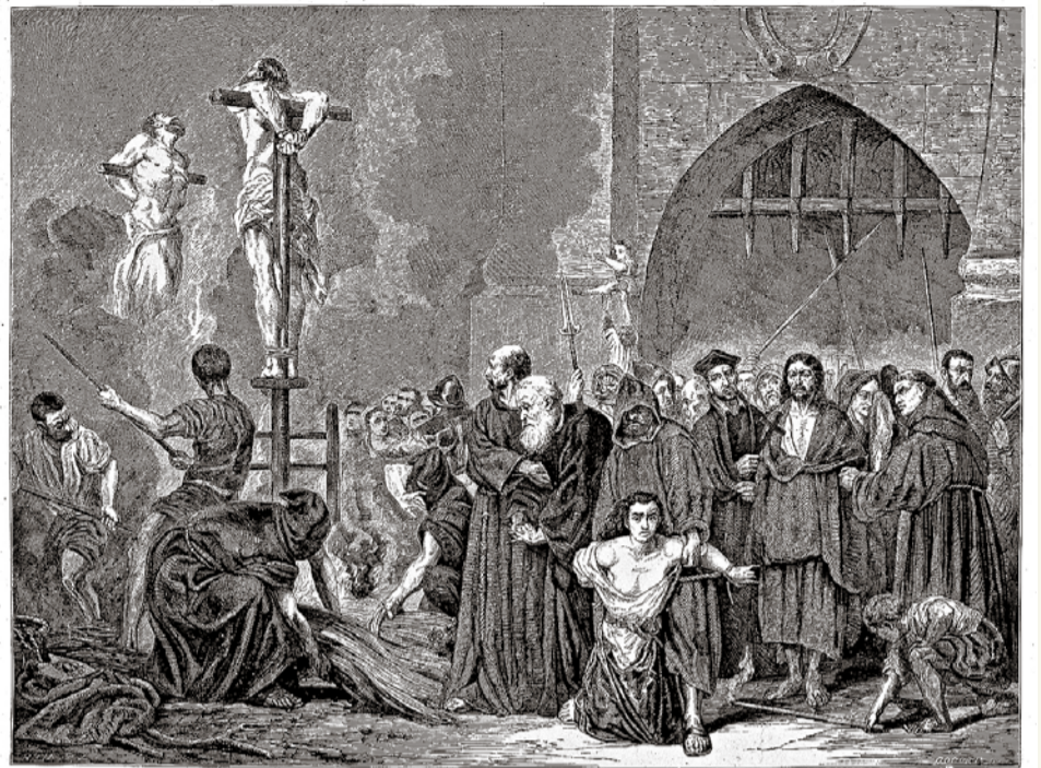
Un auto de fe. (Cuadro de M. Robert Fleury.)

Arriba izquierda: Sixto IV por Tiziano (ca. 1545-46).