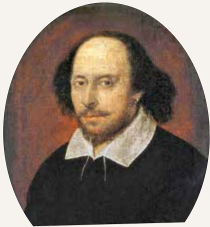
← El Retrato Chandos, el más verosímil del escritor, atribuido a John Taylor (1509, National Portrait Gallery).