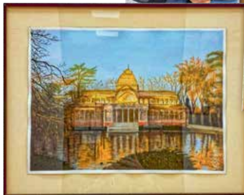
↕ Algunas de las obras expuestas y su autora.