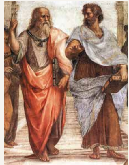
Busto de Aristóteles en Roma, Palazzo Altemps. La Sabiduría entregando la llave de la Razón a Aristóteles (c. 1690). Platón y Aristóteles en la Escuela de Atenas, por Rafael (1509).