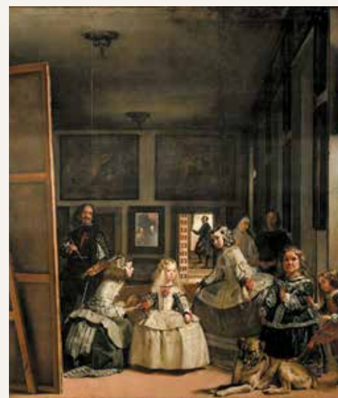
◆◆◆◆◆ "El triunfo de Baco" (conocido como "Los borrachos") y autorretrato. ◆◆◆◆◆ "Felipe IV de castaño y plata". ◆◆◆◆◆ "Las meninas".

1599: NACE VELÁZQUEZ EN SEVILLA EL 6 DE JUNIO